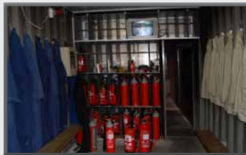
Opleiding in onze mobiele trainingsunit