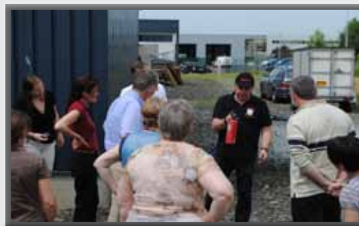
Opleiding buiten, op uw bedrijfsite

De brandopleidingen gebeuren met behulp van onze mobiele trainingsunit of buiten, op uw eigen bedrijfsite.